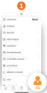
1 คลิกที่ "เงิน" จากนั้น เลือก "รับเงินของฉัน"