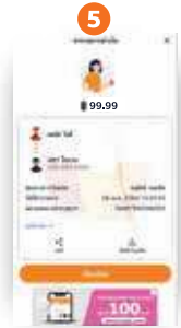
5 ทำการการรับชำระสำเร็จ ร้านค้าจะได้รับ การแจ้งเตือนเงินเข้า

* ร้านค้าสามารถตรวจสอบการชำระเงินผ่าน QR Code ได้ทันที โดยสังเกตจากเครื่องหมายถูก ที่กระพริบบนหน้าจอของลูกค้า หรือเช็คข้อความ SMS จากบริการแจ้งเตือนเงินเข้า