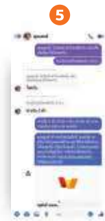
5 ส่งลิงก์ให้ลูกค้าเพื่อรับชำระค่าสินค้า (โดยลูกค้าสามารถกดลิงก์เพื่อโอนเงินได้ทันที และร้านค้าจะได้รับการแจ้งเตือนผ่านแอป/ SMS เมื่อลูกค้าทำการโอนเงินเรียบร้อยแล้ว)