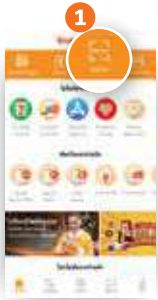
1 แจ้งลูกค้า คลิก "สแกน"