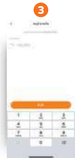
3 กรอกจำนวนเงิน ของสินค้านั้นๆ