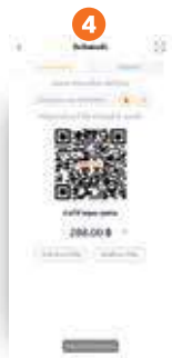
4 คลิกที่ "สัญลักษณ์คัดลอก" ข้อความ "คัดลอกลิงก์เรียบร้อยแล้ว" จะปรากฏเมื่อทำการคัดลอกลิงก์สำเร็จ