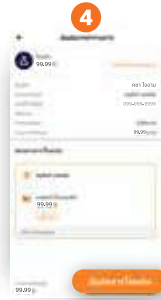
4 ลูกค้าตรวจสอบ ข้อมูล และคลิก "ยืนยันการโอนเงิน"