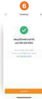
6 ทำการเพิ่มเบอร์โทรศัพท์ พนักงานสำเร็จเรียบร้อยแล้ว

* เจ้าของร้านสามารถเพิ่มเบอร์พนักงานได้สูงสุด 5 เบอร์ และลบเบอร์ออกได้เมื่อพนักงานลาออก