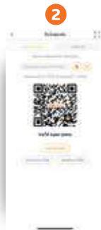
2 คลิกปุ่ม "ระบุจำนวนเงิน" เพื่อใส่จำนวนเงินของสินค้า