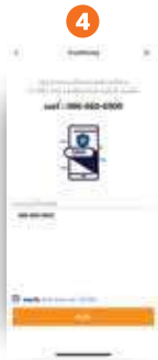
4 กรอกเบอร์โทรศัพท์พนักงาน ที่ต้องการเพิ่ม แล้วคลิก “ยืนยัน”