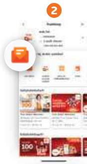
2 คลิก “SMS รู้ทั้งร้าน”