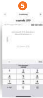
5 กรอก “รหัส OTP” ที่ได้รับ