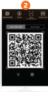
2 ร้านค้ายื่น QR ให้ลูกค้าสแกน