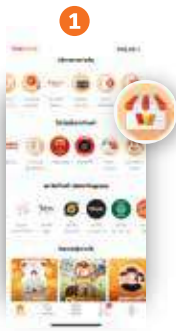
1 คลิก “บริการด้านร้านค้า”

เพิ่มเบอร์พนักงาน เพื่อรับ SMS แจ้งเตือนเงินเข้าง่ายๆ ด้วยมือถือของเจ้าของร้านค้า