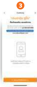
3 คลิก “เพิ่มเบอร์โทรศัพท์ พนักงาน”